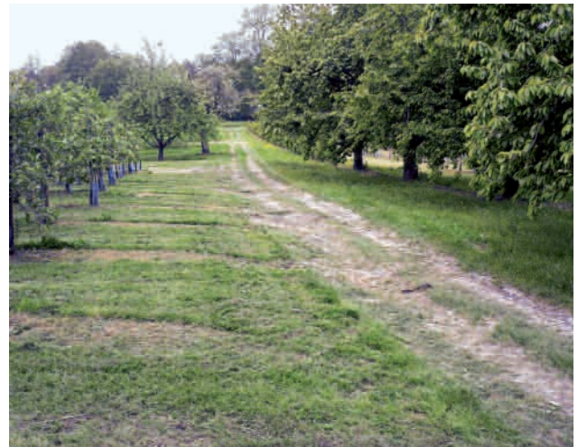
Abb. 2 und 3: Typische Ausschnitte des Nahrungshabitats des Wiedehopfes.