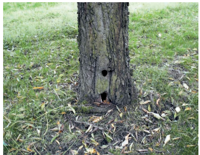
Abb. 5: Naturhöhle in Kirschbaum (oben). Die untere Öffnung wurde von einem Raubsäuger aufgebrochen, der das Gelege erbeutete.