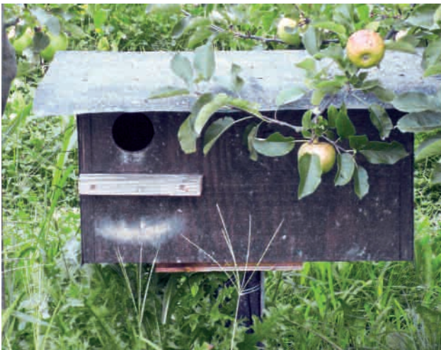
Abb. 4: Wiedehopf-Nistkasten auf einem etwa 50 cm hohen Pfahl - nur empfehlenswert im biologischen Landbau ohne Gifteintrag. Hier flogen 2010 vier Jungvögel aus.