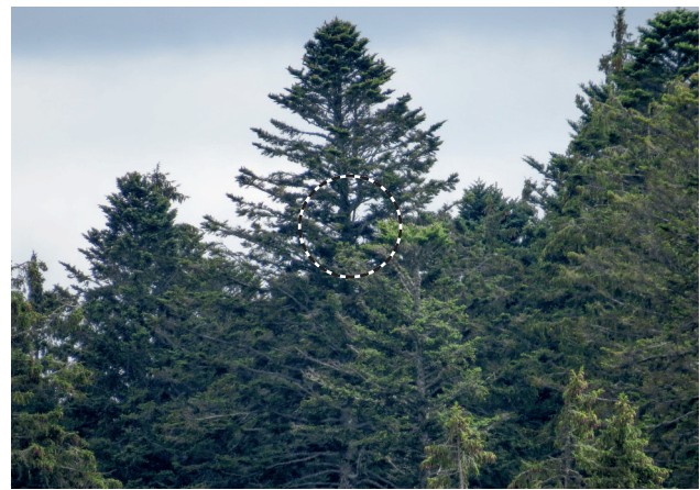
Abb. 2 und 3: Ausschnitte aus Abb. 1. Der Kreis in Abb. 2 markiert die Horsttanne. Der Horst befand sich am Stamm der Tanne (Kreis in Abb. 3).

FR). Der Horst befand sich östlich des Ebenemooses an einem nach Norden geneigten Hang zwischen 1040 und 1050 m NN (Koordinatenfeld 47°58' N / 8°14' E) in einer den Fichtenwald überragenden Tanne ( Abies alba ). Der Brutbaum samt Horst ließ sich mit Spektiv vom rund 700 m entfernten Parkplatz beim Hochebenehof beobachten. Von diesem Parkplatz aus wurden auch die Aufnahmen gemacht (Abb. 1 bis 3).