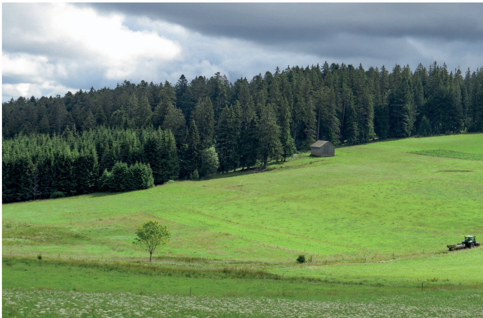
Abb. 1: Blick nach Nordosten vom Parkplatz beim Hochebenhof, Oberschwärzenbach. Brutrevier des Schwarzmilans 2014. Die Hütte am Waldrand liegt auf etwa 1065 m NN.

Das Brutrevier lag zwischen Eisenbach – Höchstberg und Oberschwärzenbach (Gemeinde Titisee-Neustadt